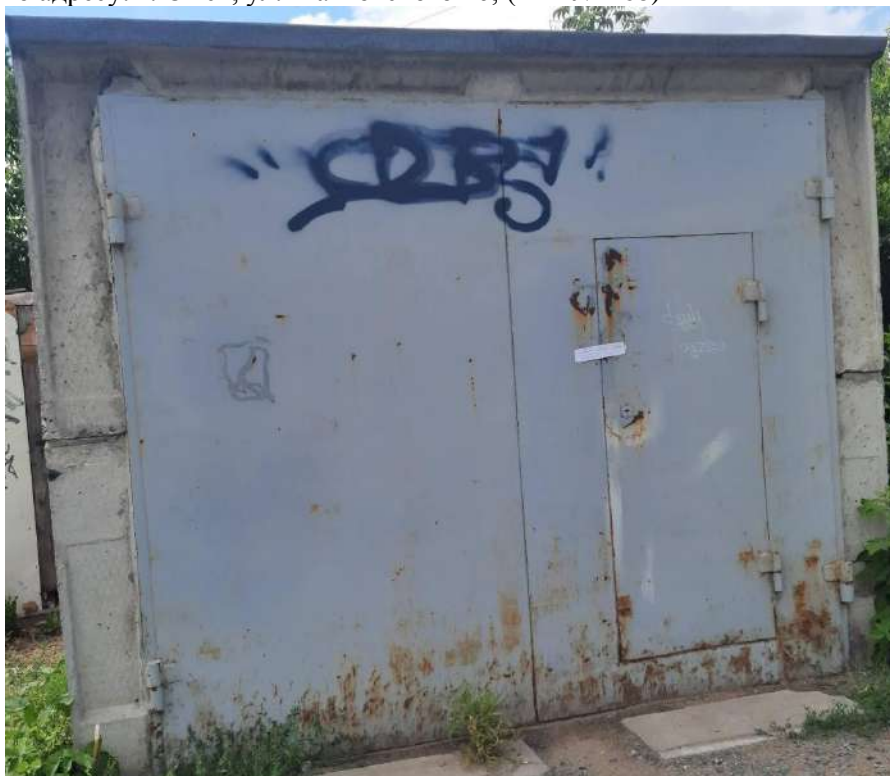
120) Временный железобетонный гараж, размещенный вблизи многоквартирного жилого дома по адресу: г. Омск, ул. Маяковского 16; (Акт № 469)