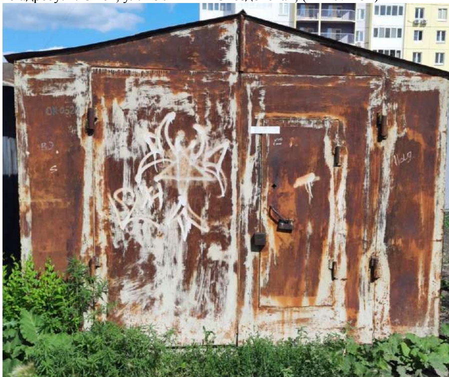
104) Временный металлический гараж, размещенный вблизи многоквартирного жилого дома по адресу: г. Омск, ул. 18 Линия - Съездовская; (Акт № 453)