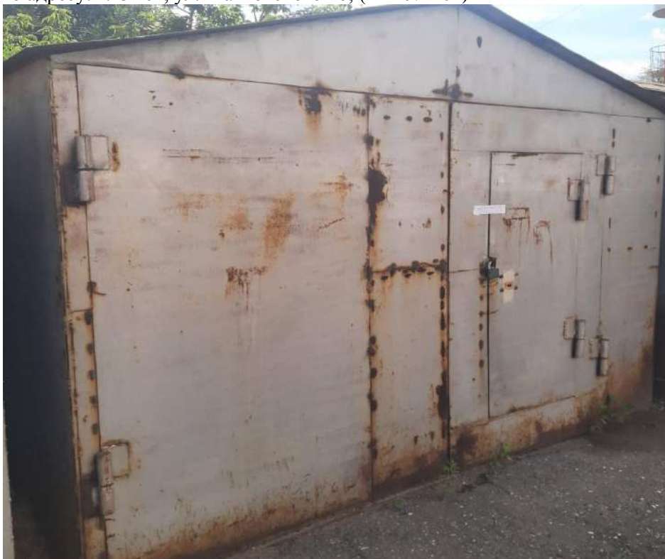
116) Временный металлический гараж, размещенный вблизи многоквартирного жилого дома по адресу: г. Омск, ул. Маяковского 16; (Акт № 465)