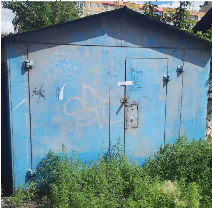
118) Временный металлический гараж, размещенный вблизи многоквартирного жилого дома по адресу: г. Омск, ул. Маяковского 16; (Акт № 467)