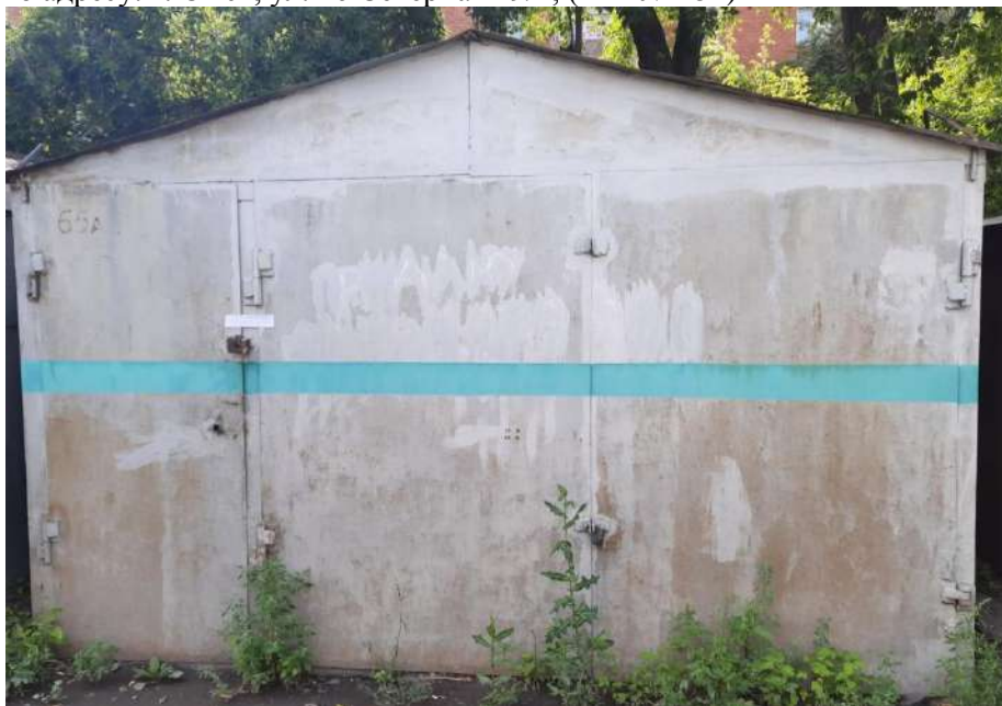
106) Временный металлический гараж, размещенный вблизи многоквартирного жилого дома по адресу: г. Омск, ул. 26 Северная 19/1; (Акт № 455)