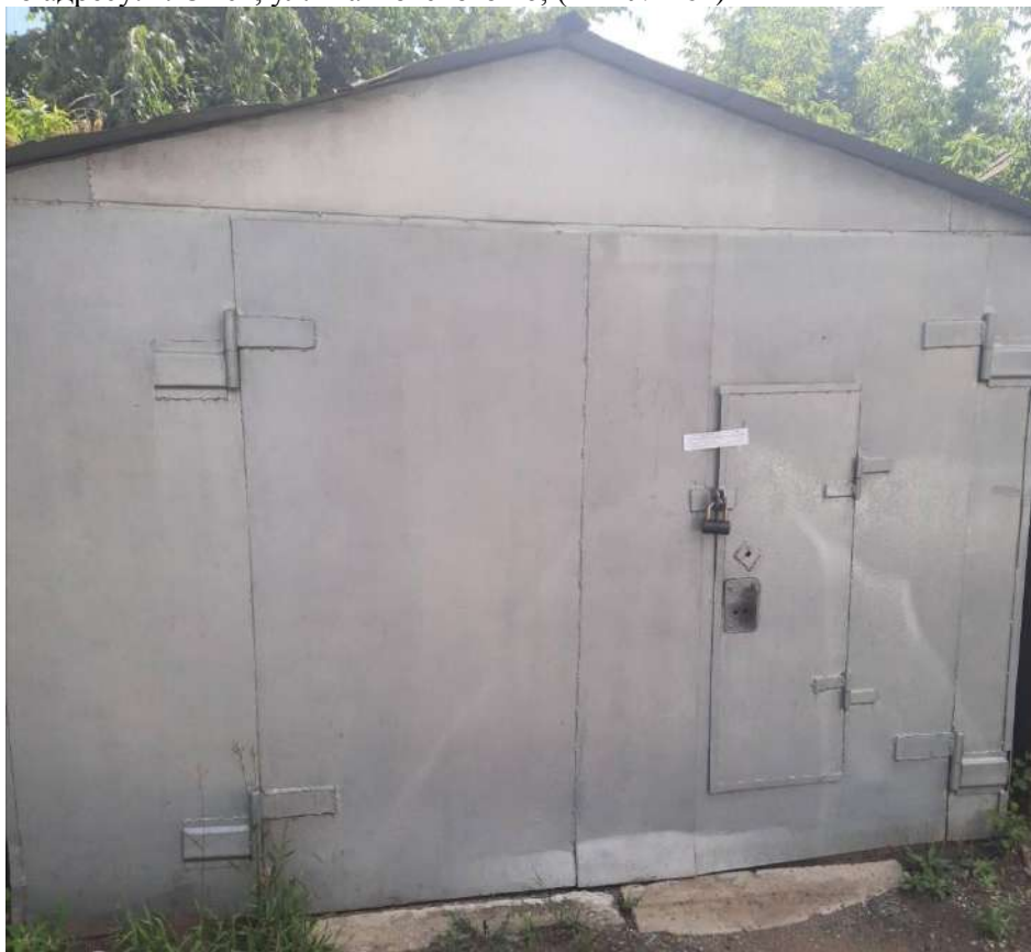
114) Временный металлический гараж, размещенный вблизи многоквартирного жилого дома по адресу: г. Омск, ул. Маяковского 16; (Акт № 463)