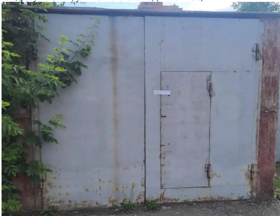
110) Временный металлический гараж, размещенный вблизи многоквартирного жилого дома по адресу: г. Омск, ул. Маяковского 16; (Акт № 459)