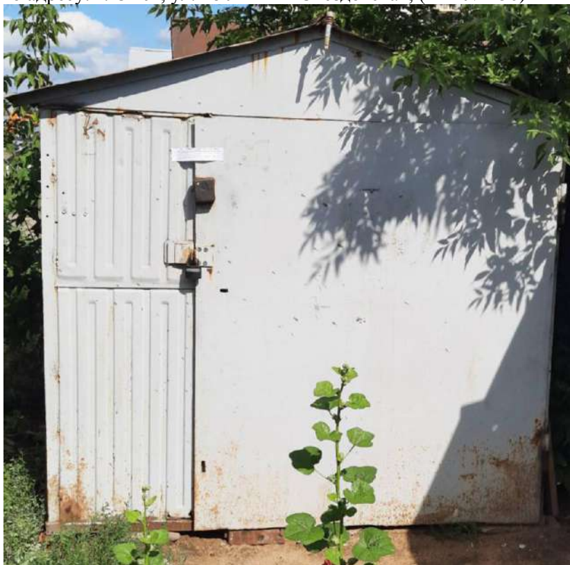
102) Временный металлический гараж, размещенный вблизи многоквартирного жилого дома по адресу: г. Омск, ул. 18 Линия - Съездовская; (Акт № 451)