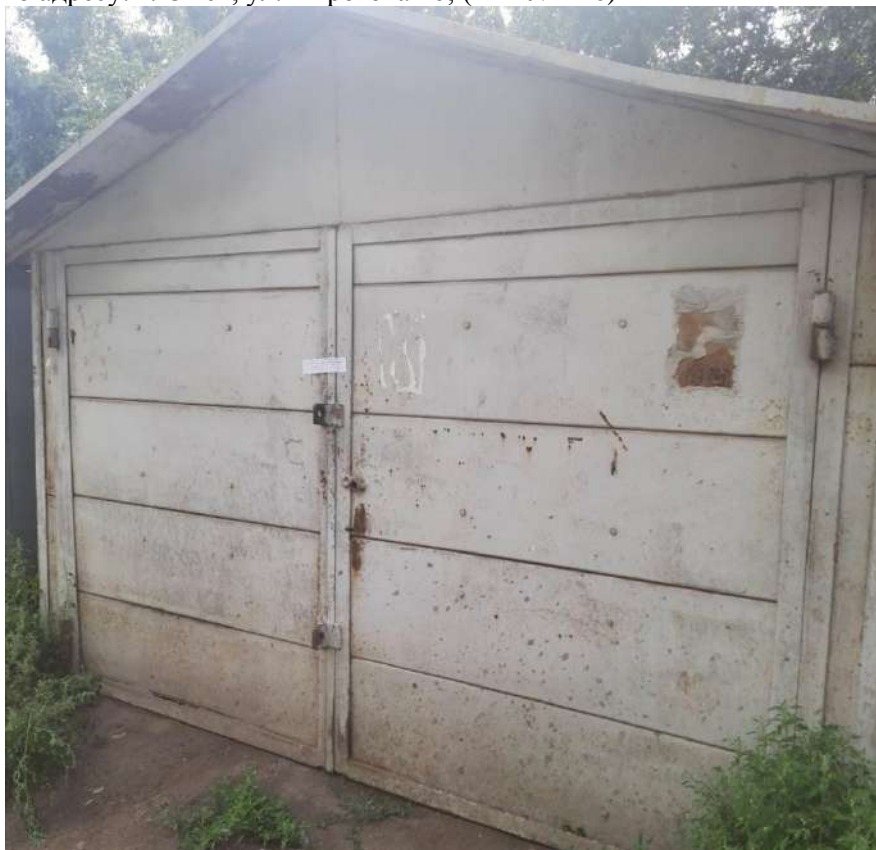
68) Временный металлический гараж, размещенный вблизи многоквартирного жилого дома по адресу: г. Омск, ул. Пирогова 46; (Акт № 417)