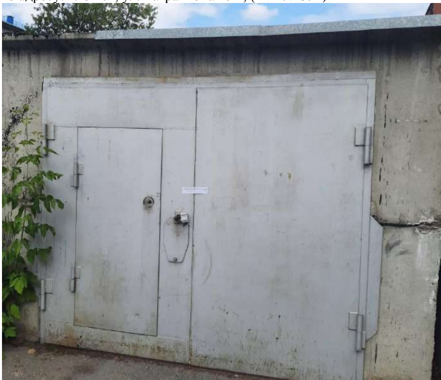
46) Временный железобетонный гараж, размещенный вблизи многоквартирного жилого дома по адресу: г. Омск, ул. Багратиона 15В; (Акт № 395)